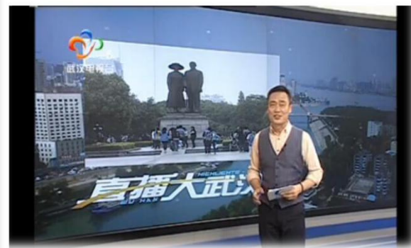
公园大课堂来了批“小老师”——4月17日直播大武汉