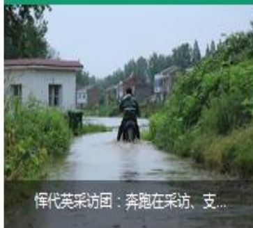
恽代英采访问：奔跑在采访、支...